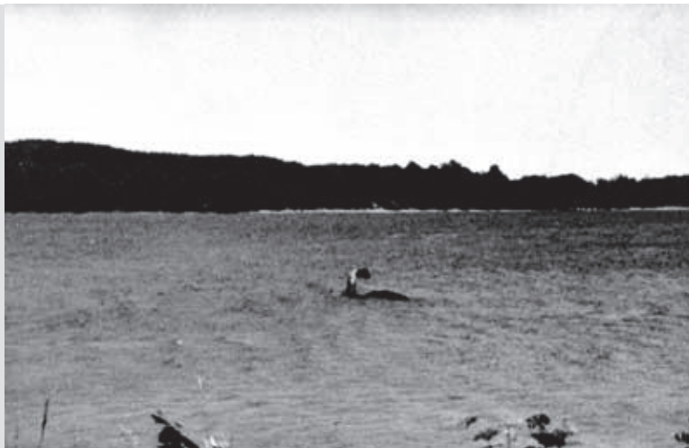
L'objet photographié par Sandra Mansi au lac Champlain.

Ceux qui n'y croient pas (les sceptiques) disent que pour assurer leur continuité, il en faudrait au moins 50 dans le lac.